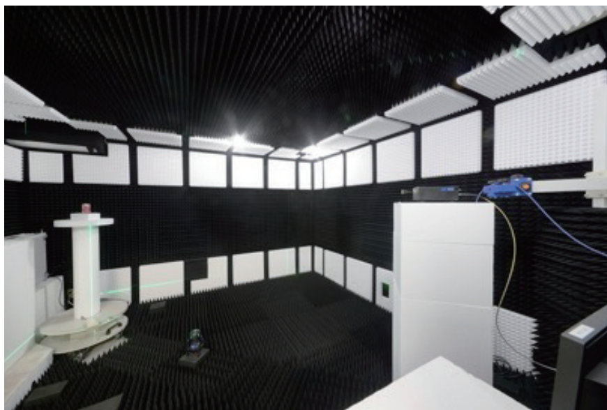
小型アンテナ評価暗室内部