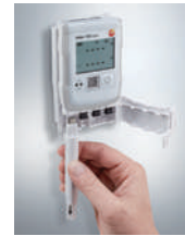
デジタルプローブ装着例