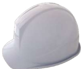
アメリカンタイプ