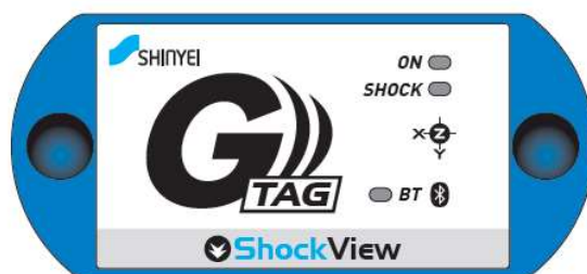
G-TAG Shock View本体外観

携帯端末（スマートフォンなど）から無線通信することで、ケーブルレスで計測データの確認ができるため、梱包内に設置後にも開梱することなく、現場で即座にアクセスが可能です。