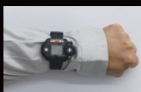
腕装着時(腕時計型) ※時計ベルト装着