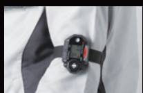
腕装着時(バンド型) ※アームバンド装着