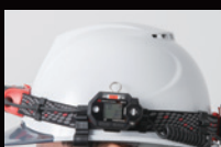
ヘルメットバンド装着時 ※ベルトクリップ装着