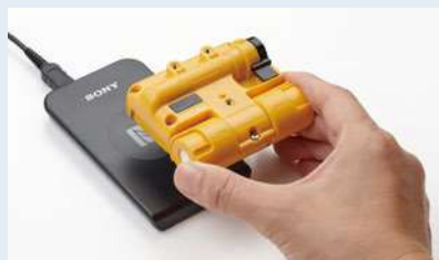
検知器をカードリーダーにかざし専用ソフトのスタートボタンを押すだけ