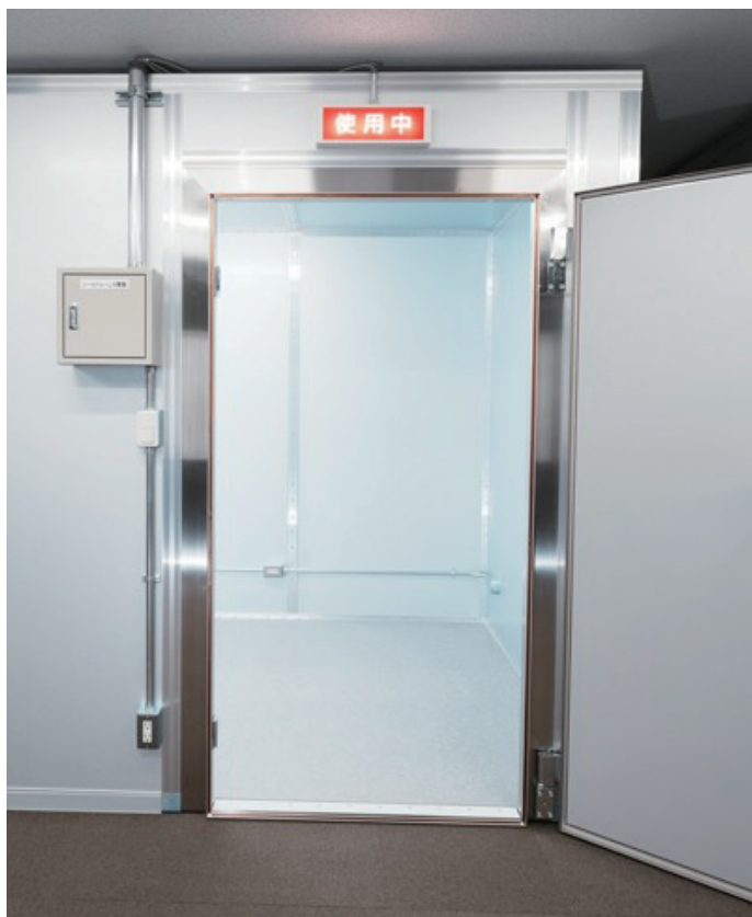
ナイフエッジタイプシールド扉（低段差仕様）