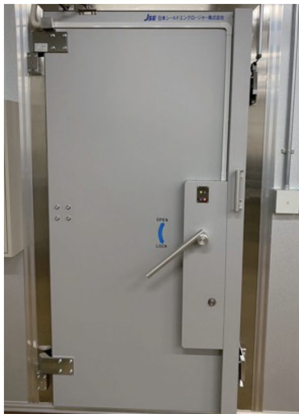
セキュリティ仕様（鍵付き・RFID）

※手動扉は、開閉動作容易（軽い）です。低段差仕様のため機器搬入がスムーズに行えます。