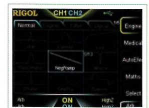
160以上の波形を内蔵