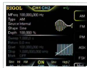
豊富なアナログ・デジタル変調機能