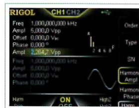
8次高調波ジェネレータ機能