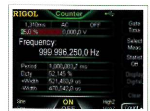
高分解能カウンターと統計解析機能