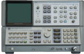
【修理・再設計の事例】