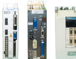
【基板の再設計事例】