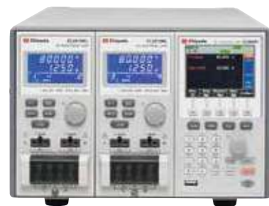
CL2200F ¥144,000 (税抜)