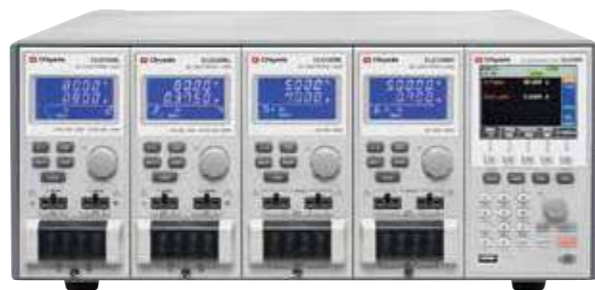
CL2400F ¥184,000 (税抜)