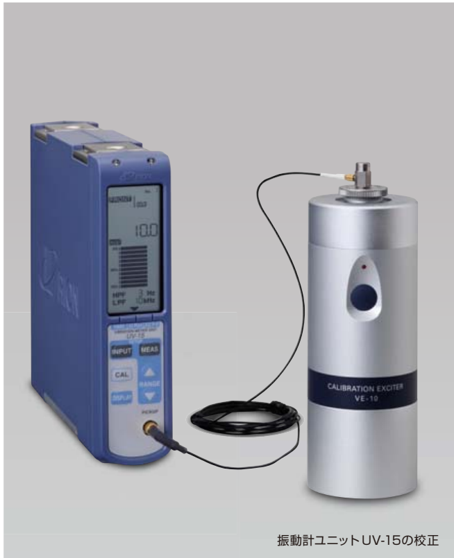
振動計ユニットUV-15の校正

VE-10はハンディタイプの加振器で、圧電式加速度ピックアップおよび、それを用いた振動計や振動計測システムを校正するための、単一周波数の基準振動源（正弦波）です。直径5 cm、長さ13 cm、重さ600 gと、小型軽量のため持ち運びが容易です。また、乾電池動作のため現場で使用することができます。