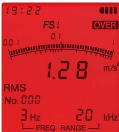
オーバーロード画面