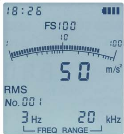
バックライトの点灯