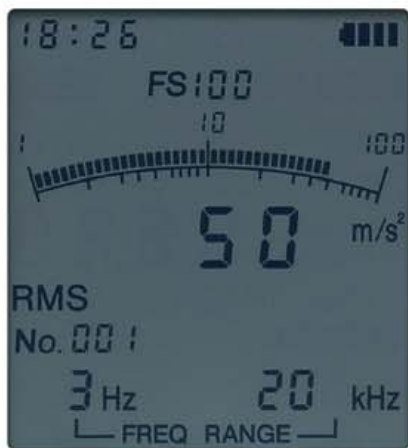
測定データの表示画面

液晶画面にはバークラフと数値が同時に表示され、変動の様子を容易に把握。設定した周波数範囲などの情報も表示し、バックライト機能により暗所でも内容を確認できます。オーバーロードの状態になると、OVERが表示され、液晶全体が赤色に変わります。