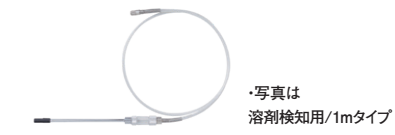
ガス導入管(1・2・3・5・10m) 通常用[SH-301]/溶剤検知用[SH-401] ※仕様は検知対象ガスによる。詳細はお問い合わせください。