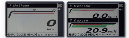
▶ 通常時(1ガス検知) ▶ 通常時(2ガス検知)