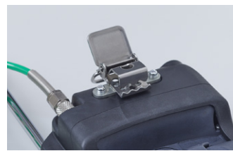
アリゲータークリップ[ST-20] ベルト等に引掛けて使用することが可能です。