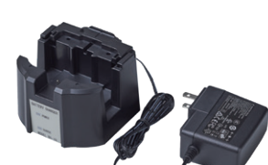
充電器[BC-10] ニッケル水素充電電池の充電をします。また本体に電池が入ってない状態でもAC電源から電力供給が可能です。