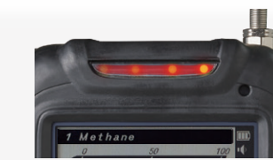
▶ 赤い4つのランプが点滅し、アラーム音と共に異常をお知らせ