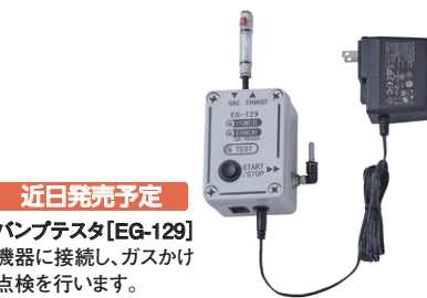
近日発売予定 バンプテスタ[EG-129] 機器に接続し、ガスかけ点検を行います。