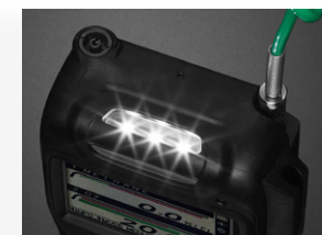
▶ 暗所でも作業しやすい照明ランプ