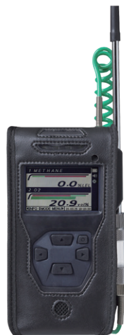
レーザーカバー[C-37] 汚れや傷から本体を保護します。