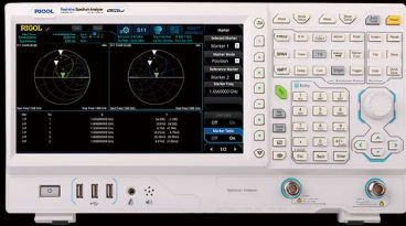
ベクトル・ネットワーク ・アナライザ 型番 : RSA3045N

周波数範囲 : 9KHz~4.5GHz リアルタイム帯域幅 : 40MHzリアルタイムモード (オプション適用) 表示平均ノイズレベル : -161dBm(代表値) (プリアンプON) EMI測定機能 (オプション適用) パッケージ価格通常 : ¥ 1,229,200 キャンペーン特価 : ¥ 889,800