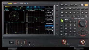
ベクトル・ネットワーク ・アナライザ 型番 : RSA5065N

周波数範囲 : 9KHz~3.0GHz リアルタイム帯域幅 : 40MHzリアルタイムモード (オプション適用) 表示平均ノイズレベル : -161dBm(代表値) (プリアンプON) EMI測定機能 (オプション適用) パッケージ価格通常 : ¥ 1,069,200 キャンペーン特価 : ¥ 729,800