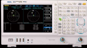
ベクトル・ネットワーク ・アナライザ 型番 : RSA3030N

周波数範囲 : 9KHz~4.5GHz リアルタイム帯域幅 : 40MHzリアルタイムモード (オプション適用) 表示平均ノイズレベル : -161dBm(代表値) (プリアンプON) EMI測定機能 (オプション適用) パッケージ価格通常 : ¥ 1,229,200 キャンペーン特価 : ¥ 889,800