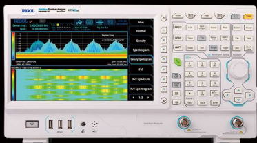
リアルタイム・スペクトラム ・アナライザ 型番：RSA3015E

周波数範囲：9KHz～3.0GHz リアルタイム帯域幅：10MHz リアルタイムモード 表示平均ノイズレベル：-161dBm(代表値) (プリアンプON) EMI測定機能 (オプション適用) パッケージ価格通常：¥625,600 キャンペーン特価：¥488,000