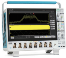
5/6シリーズB MSO ミックスド・シグナル・ オシロスコープ