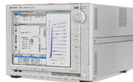
B1500A 半導体デバイス・パラメータ・アナライザ