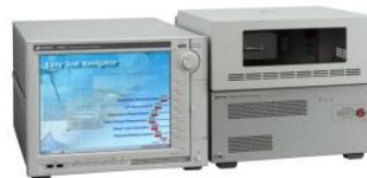
B1505A / 6A パワー・デバイス・アナライザ