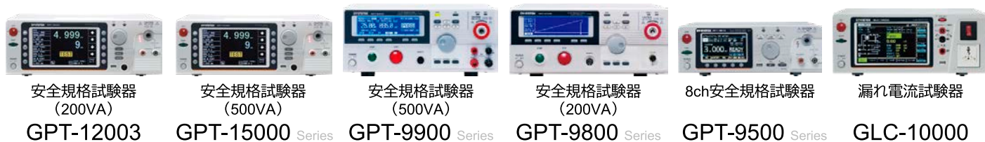
安全規格試験器 (200VA) GPT-12003