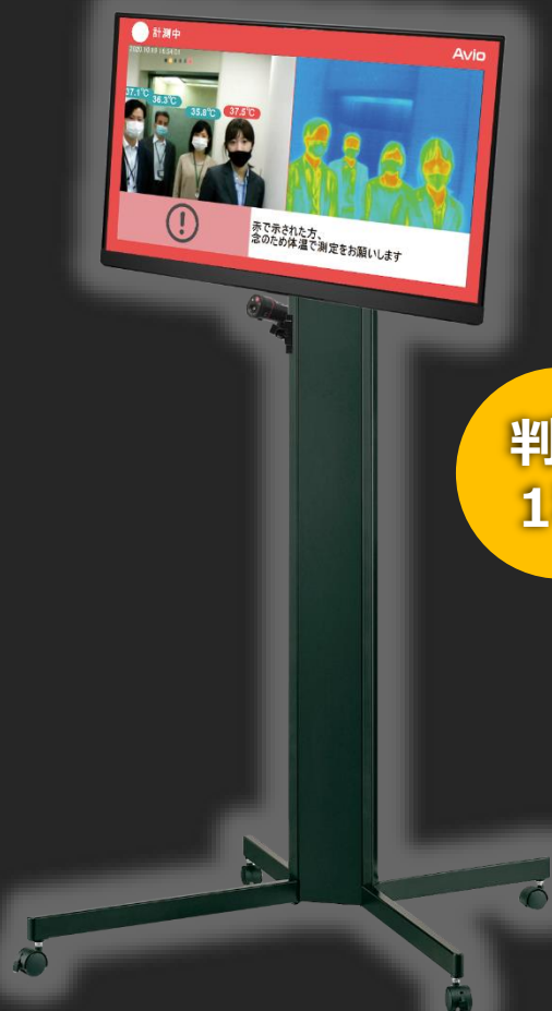
スタンドとの組み合わせは一例です

セルフチェックでも ウォークスルーでも 受付からイベントまで これ1台で発熱者対策！