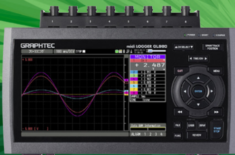
GL980 定価350,000円 (税込385,000円)

2020年12月1日～2021年1月29日に 下記対象機種をご購入のお客様に専用プロテクトカバーを 1台につき、1個先着順にてプレゼント!