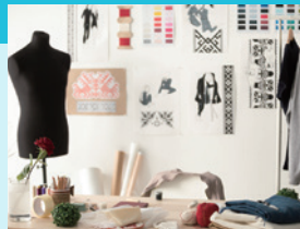
少量のグッズ制作