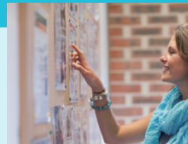
掲示物や、イベントに