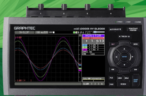
GL2000 定価220,000円 (税込242,000円)