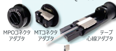
MPOコネクタアダプタ MTコネクタアダプタ テープ心線アダプタ