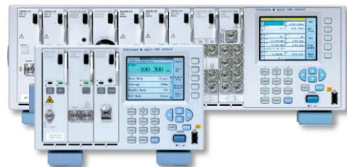
AQ2211 3スロットモデル AQ2212 9スロットモデル